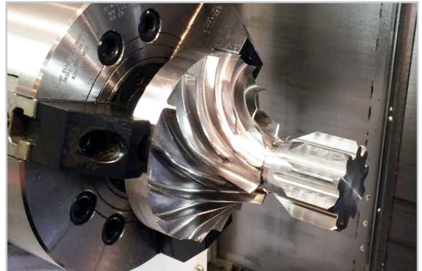
Impellerdetalj bearbetad i en Mazak Integrex.

Gibbs MTM har utvecklats med dessa komplexa maskiner i fokus. Den stöder därför obegränsat antal spindlar och verktygsbärare, och kan adapteras mot alla CNC styrsystem. Varje maskinapplikation i GibbsCAM är anpassad exakt för varje maskin, varje programmeringslösning erbjuder kontroll över exakt de enheter som din maskin är utrustad med (stöddocka, robotladdare, stångaggregat, dubb etc).